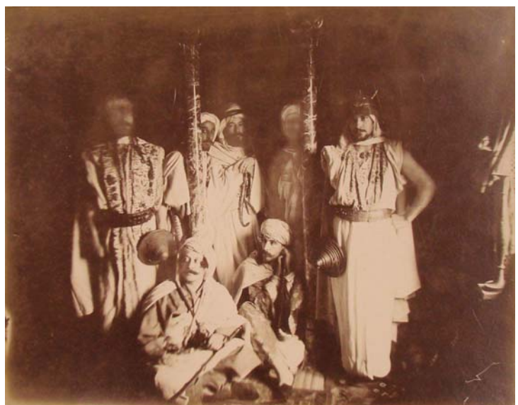
Fête arabe chez Pierre Loti le 8 novembre 1889, photographie

La maison de Loti à Rochefort, qu'il a passé sa vie à transformer, n'est pas seulement un espace théâtralisé destiné à surprendre ses amis, elle reflète plus profondément le personnage. Juxtaposition de reconstitutions d'escales plus ou moins heureuses de sa vie, elle est censée figer ces instants, décor fait pour le ressassement égoïste. La mosquée (1895-1897) est l'exemple le plus abouti de ces décors orientaux qui, selon le mot de Guitry, « n'est pas une mosquée, mais un désir ardent, très émouvant d'être une mosquée ». C'est en fait un tombeau dédié à la vie en fuite où Loti aime à s'ensevelir auprès de la stèle d'Aziyadé.