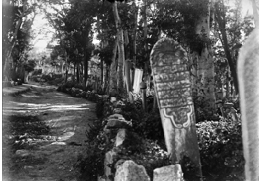
Pierre Loti, Cimetière d'Er-dinekapi , retirage d'une plaque de verre

A l'exact opposé, se situe le Loti ottoman, turcophile sans compromis qui inaugure en 1879, par son premier roman Aziyadé , une passion jamais démentie pour les Turcs. Par la suite, il écrit des ouvrages où la fiction laisse le pas aux témoignages souvent polémiques sur ce qu'il considère comme sa deuxième patrie. Aussi, à Constantinople, Loti est vêtu mais non déguisé en Turc. Ici, il ne joue pas de rôle mais se veut un vrai bourgeois stambouliote, marquant ostensiblement son engagement sans faille et parfois aveugle à défendre l'empire Ottoman - attitude toujours controversée presque un siècle après sa mort.