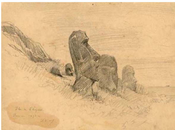
Pierre Loti, Sur le versant du cratère de Rano Raraku, île de Pâques, janvier 1872 , crayon graphite, mine de plomb

Pendant le voyage de la Flore dans le Pacifique (1871-1872), le jeune aspirant Julien Viaud assiste, lors de son bref passage à l'île de Pâques, à la destruction d'une population unique. Peu après, aux Marquises, il est de nouveau confronté et fasciné par la perte d'un monde et tâche, comme à l'île de Pâques, de conserver par le dessin la mémoire des lieux et des personnages. Cette expérience sera décisive dans sa conception du rôle joué par la civilisation occidentale dans le monde. Selon lui, elle n'apporte que la déchéance et la mort. Ce sera désormais le message qu'il s'efforcera de transmettre.