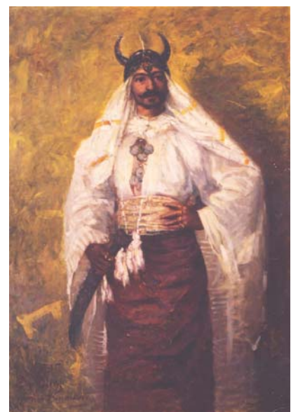
Edmond de Pury, Portrait de Loti en guerrier persan , 1895

Dès ses premiers voyages, Loti dessine et montre un réel talent. Formé enfant par Marie, sa sœur aînée, il cultive cet art et s'en sert comme moyen mnémotechnique, remplacé plus tard par la photographie, pour la rédaction de ses écrits. A partir de 1894, il opte pour celle-ci, apprise très tôt auprès de sa tante Corinne, et redécouverte par l'entremise du photographe Gervais Courtellemont. Il délaisse dès lors le dessin au profit de cette technique, où il se montre tout aussi doué, réalisant de véritables reportages durant tous ces voyages jusqu'en 1907. Comme photographe, il fait preuve d'une très grande spontanéité, en dépit de la lourdeur des contraintes techniques, et donne des images sans apprêt, bien éloignées de l'exotisme artificiel qui lui est habituellement reproché.