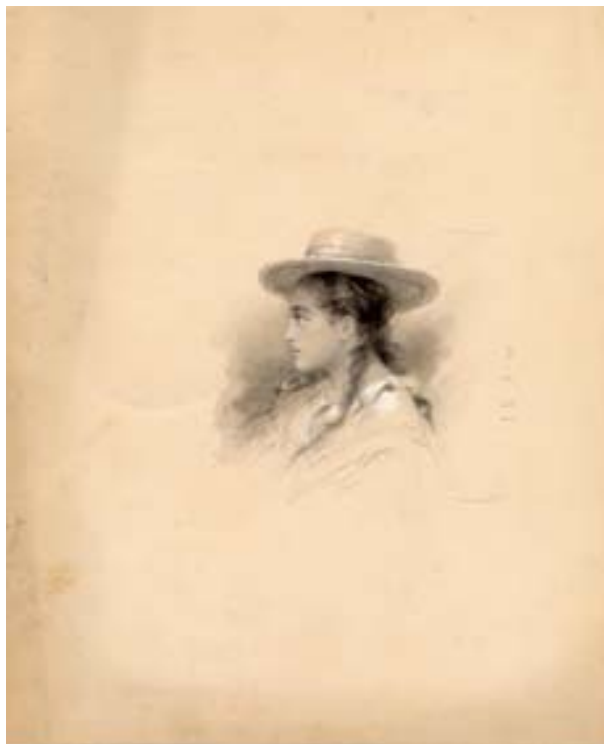
Pierre Loti, Profil de Rarahu , pour une édition illustrée du Mariage de Loti , en 1898 chez Calmann-Lévy, lavis d'aquarelle, fusain, rehauts de blanc