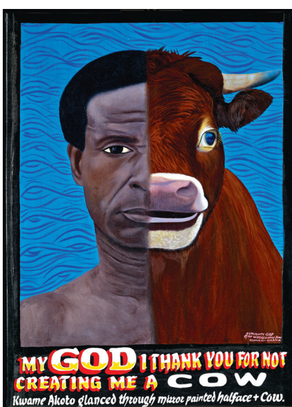
My God I thank you for not creating me a cow 2015-2016, Peinture glycérophtalique sur contreplaqué, 112,5 x 82 cm Inv. 70.2017.14.3